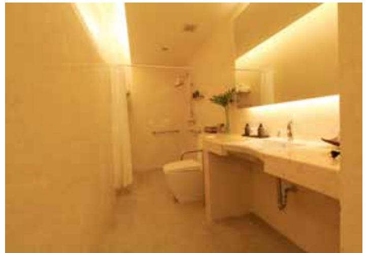
Cuarto de Baño Grande