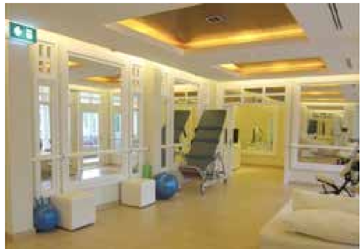
Departamento de Terapia Física