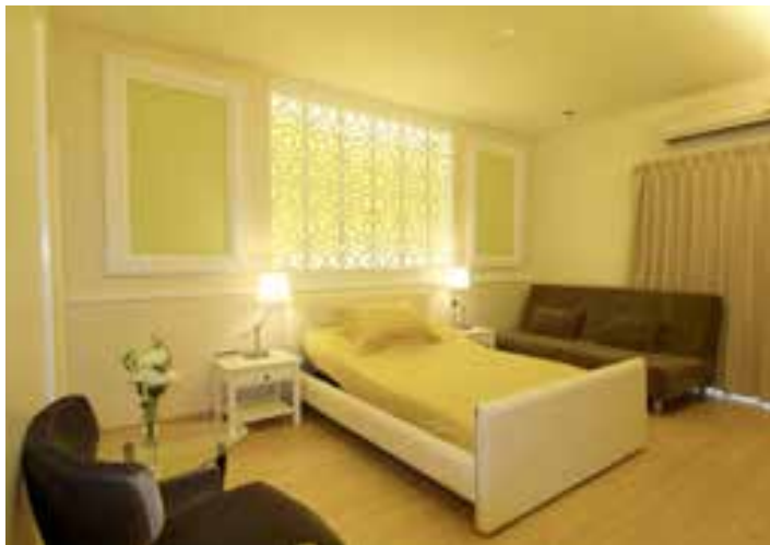
BBH Dormitorio Grande para Pacientes