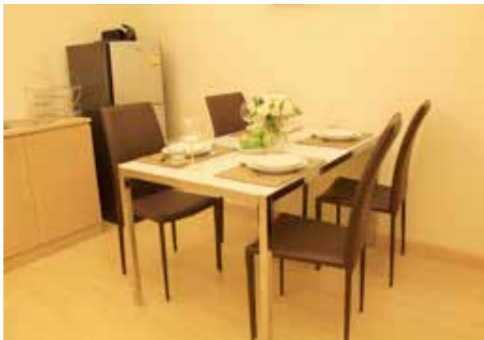
Amplia Cocina y Comedor