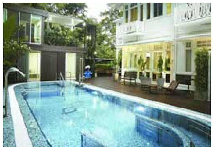
Piscina de Hidroterapia y Área Exterior